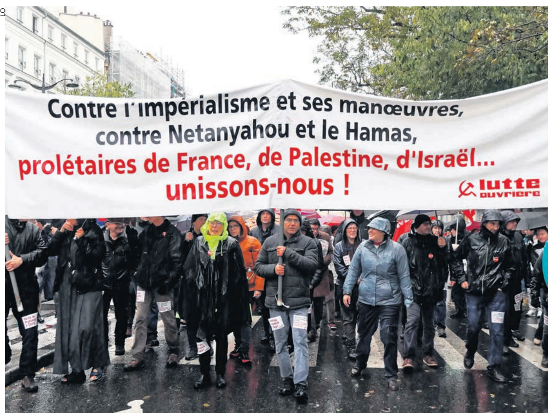
Le 18 novembre à Paris.