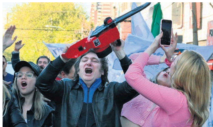
Milei brandissant une tronçonneuse pendant sa campagne.

Milei prétend gouverner sans ministre du Travail, de l'Environnement, de la Santé, de l'Éducation, des Femmes... on en passe. Et il a d'ores et déjà reçu le soutien de ses modèles politiques, Donald Trump et Jair Bolsonaro. Il a parlé aussi de supprimer la Banque centrale et le peso, la monnaie nationale, « un excrément » selon lui, pour la remplacer par le dollar. Il est aussi climatosceptique, anti-avortement, partisan de la vente libre des armes et des organes ! On verra ce qu'il restera de ce programme quand il entrera en fonction en décembre prochain. Pour l'instant, les institutions parlementaires dont il a besoin pour gouverner sont plutôt aux mains