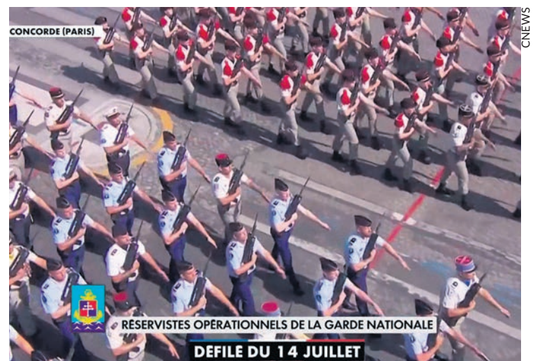
Des réservistes de la SNCF dans le défilé du 14 juillet.