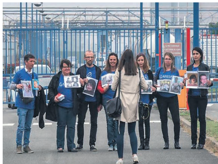
Familles réunies, le 16 octobre 2018, devant l'usine Sanofi produisant la Depakine à Mournex.

Quand, grâce au courage et à la détermination des parents, Sanofi a été condamné à verser quelques indemnités à quelques victimes, il a fui sa responsabilité et a nié.