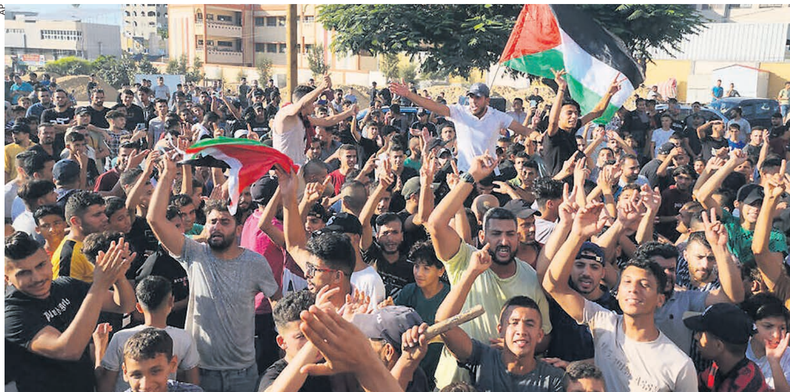
À Gaza, le 30 juillet des manifestants palestiniens scandent des slogans contre le Hamas, selon eux responsable des coupures d'électricité chroniques et des conditions de vie difficiles.