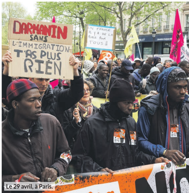
Le 29 avril, à Paris.