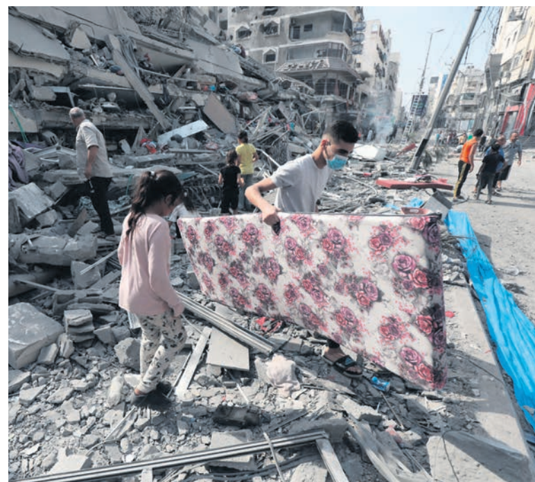
Gaza, le 8 octobre.

de masse de Gaza. Quant à leurs déclarations, même quand ils montrent une pointe d'indignation devant l'assassinat de bébés, elles relèvent du bal des hypocrites. Car, de Biden à Macron en passant par l'ONU, tous ont soutenu et continuent de soutenir « le droit d'Israël à se défendre ».