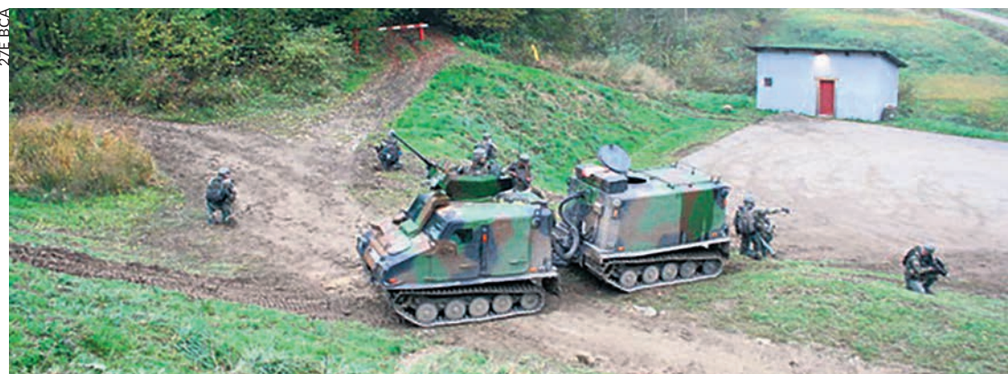
Le champ de tir du 27 e BCA.