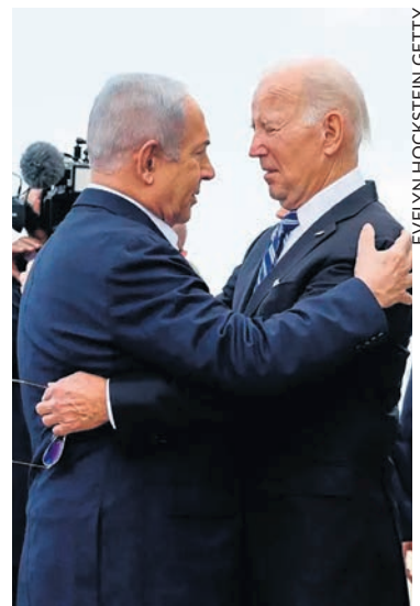
Le 18 octobre, sur le sol israélien.

S'ils n'ont jamais vraiment agi pour mettre fin au conflit israélo-palestinien, c'est qu'en réalité les dirigeants des États-Unis ont intérêt à sa permanence. La situation de tension fait d'Israël leur fidèle vassal, le gendarme dont ils ont besoin dans cette partie du monde pour y défendre leurs intérêts tant elle les intéresse pour sa richesse en pétrole, et sa position stratégique. Tant que l'impérialisme dominera, il n'y aura pas de véritable stabilité et de véritable paix, ni au Moyen-Orient, ni dans le reste du monde.