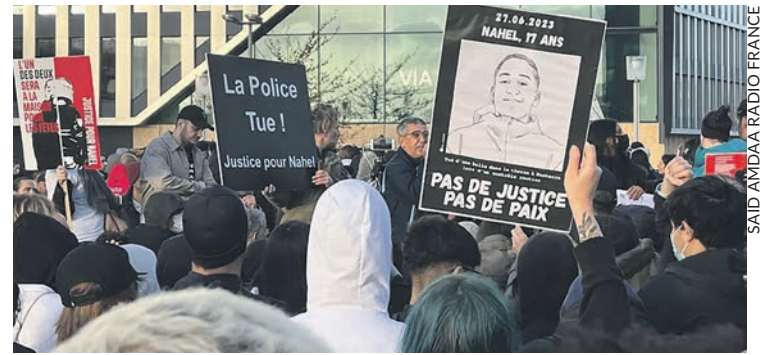
Rassemblement à Nanterre le 19 novembre.

Comme certains collectionnent les cartes Pokemon, Macron collectionne les ministres soumis à une enquête. Gérald Darmanin, Muriel Pénicaud, Olivier Dussopt, Sébastien Lecornu, Laura Flessel, Nathalie Elimas, Chrysoula