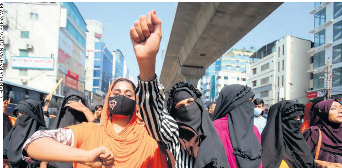
Ouvrières du textile, le 2 novembre à Dacca.